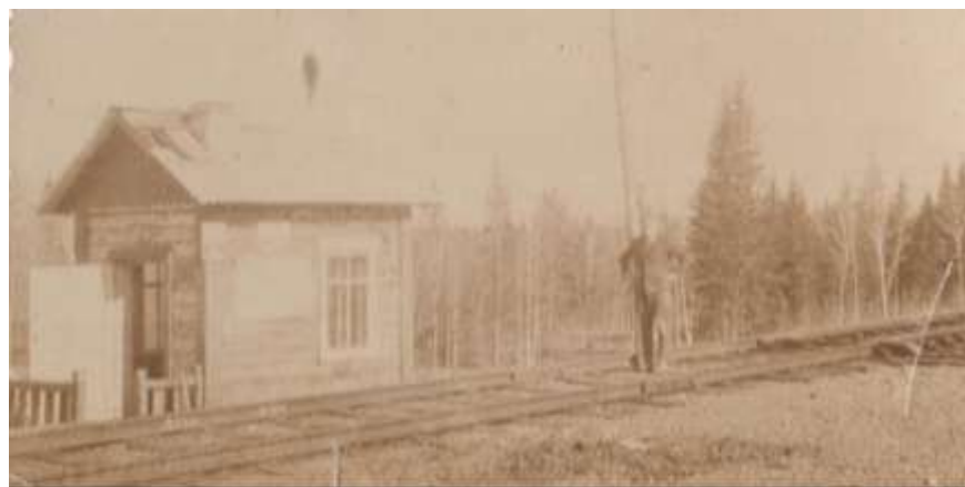
Будка стрелочника. Второй пост.

На станции был свой магазин, куда из Ачинска на поезде привозили товары. На день железнодорожника прибывал вагон - магазин с дефицитными товарами. Часто приезжал вагон-клуб, где «крутили» кино. В здании вокзала устраивались праздники для детей и взрослых.