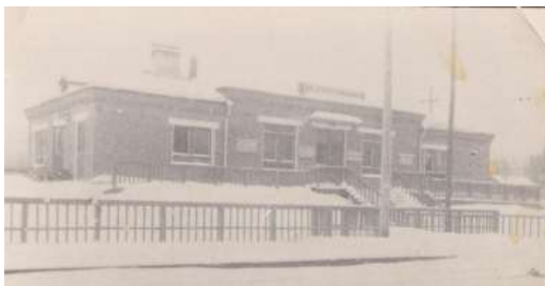
Вокзал станции Пировская 1969 год.

16 января 1963 года был забит «серебряный костыль», ознаменовавший окончание строительства этой жизненно важной магистрали. Строители со стороны Ачинска и со стороны Абалаково соединились вместе в районе села Бельское. «Серебряный костыль» был забит на железнодорожном мосту через реку Белую.