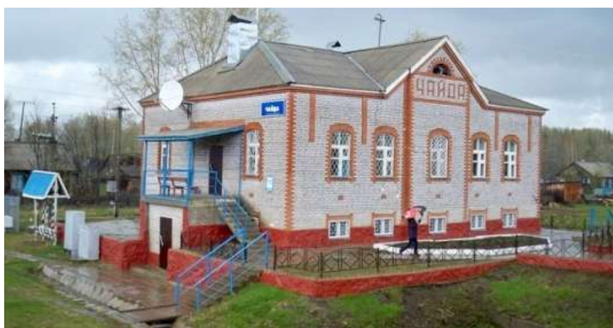
Самый красивый вокзал железной дороги на станции Чайда.