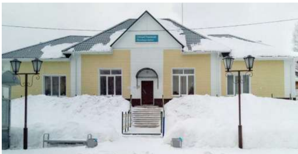
Современное здание вокзала станции Пировская 2017 год.