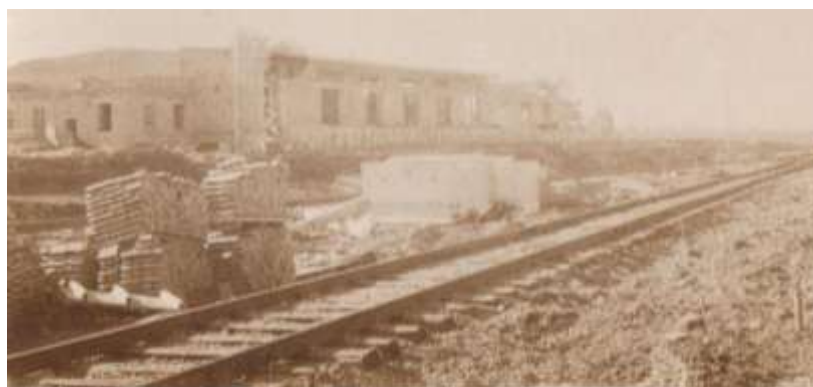
Строительство товарного склада.