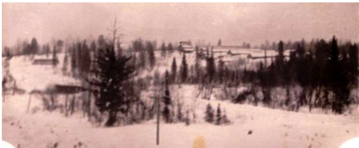
Фото кирпичного завода в селе Бельское. Видны щитовые домики рабочих.

Дутлова Кристина: Вокзал начали строить в 1963 году. Закончили в 1965 году. Здание строили из кирпича. В районе села Бельское работал свой кирпичный завод. Первым начальником станции был Григорьев.