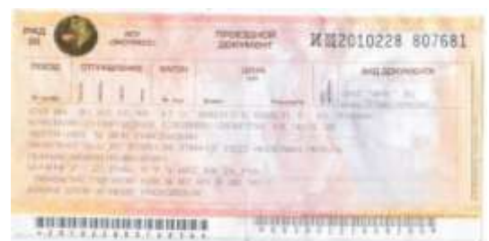
Билет на поезд №667.