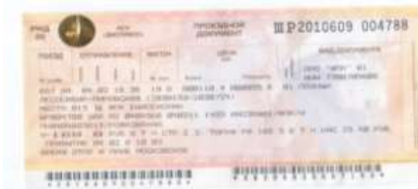
Билет на поезд №659.

Вторых Кристина: В 2000-е годы уменьшается число остановок, вагонов и поездов. Поезд №667 стал ходить только до Ачинска. В Ачинске несколько поездов присоединялись к поезду №659 «Красноярск – Абакан». Но в мае 2013 года движение поезда №659 отменили. Теперь до Красноярска нет прямого пассажирского сообщения. До Ачинска ходит только один пригородный поезд, с ним идёт всего один или два вагона.