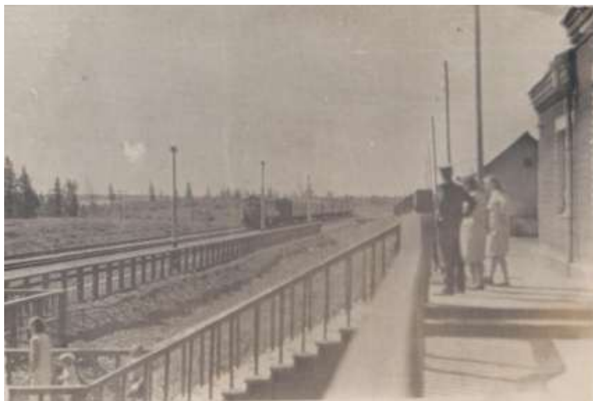
Пассажиры встречают поезд на станции Пировская.