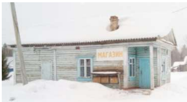
Магазин на станции Пировская. Фото 2017 года.

На станции был свой магазин, куда из Ачинска на поезде привозили товары. На день железнодорожника прибывал вагон - магазин с дефицитными товарами. Часто приезжал вагон-клуб, где «крутили» кино. В здании вокзала устраивались праздники для детей и взрослых.